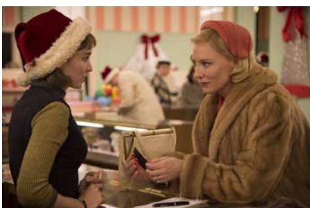
Therese (Rooney Mara) ja Carol (Cate Blanchett)